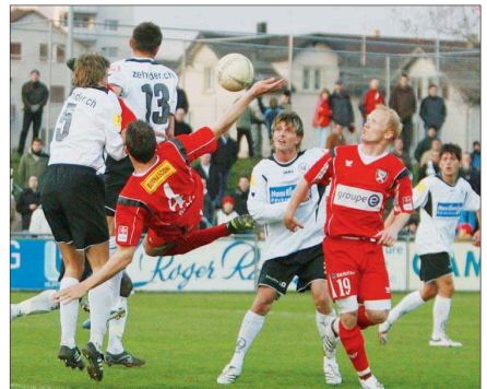
WIL - XAMAX 2-0, 31.3.07 La plus horrible prestation xamaxienne. Mais aussi sa dernière défaite de la saison...