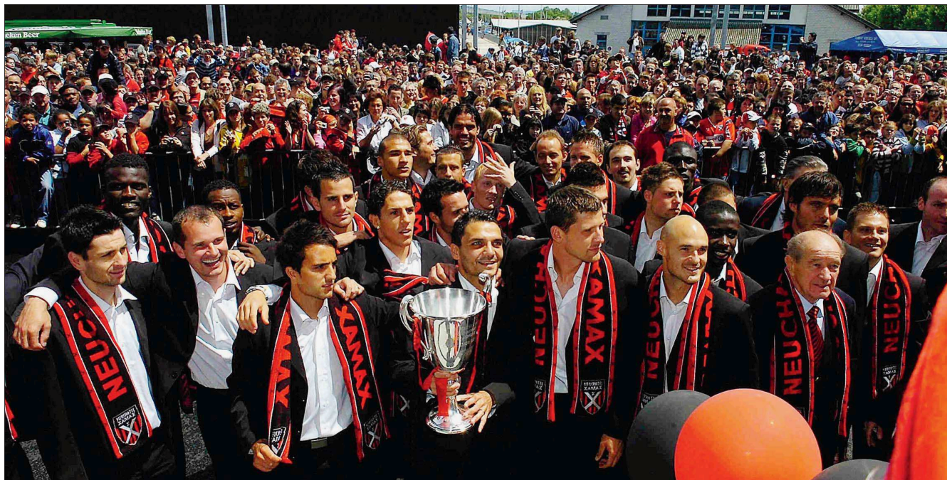
BAIN DE FOULE De grands messieurs, les footballeurs de Neuchâtel Xamax! À peine avaient-ils brandi la coupe du vainqueur de Challenge League qu'ils descendaient sur l'esplanade de la Maladière pour partager leur joie avec la foule et les fidèles supporters du club. Disponibles, les Xamaxiens ont pris du temps pour chacun. Ils ont même fait circuler le trophée dans le public, pour le plus grand bonheur des enfants.

Xamax de retour parmi l'élite suisse du football, c'est tout le canton de Neuchâtel qui en profite. Le club de la Maladière a orchestré une superbe fête dimanche pour ses supporters.