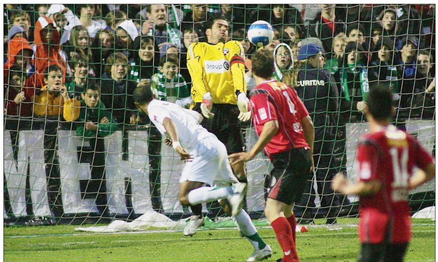
KRIENS - XAMAX 1-2, 16.5.07 Xamax est archidominé en seconde période, mais Zubi multiplie les prouesses...