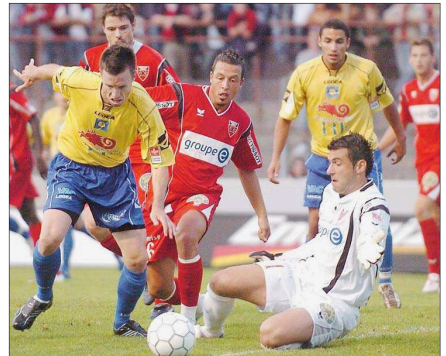
FCC - XAMAX 0-2, 23.8.06 Malgré une bonne prestation, le FCC est battu et Xamax prend la tête pour la première fois.